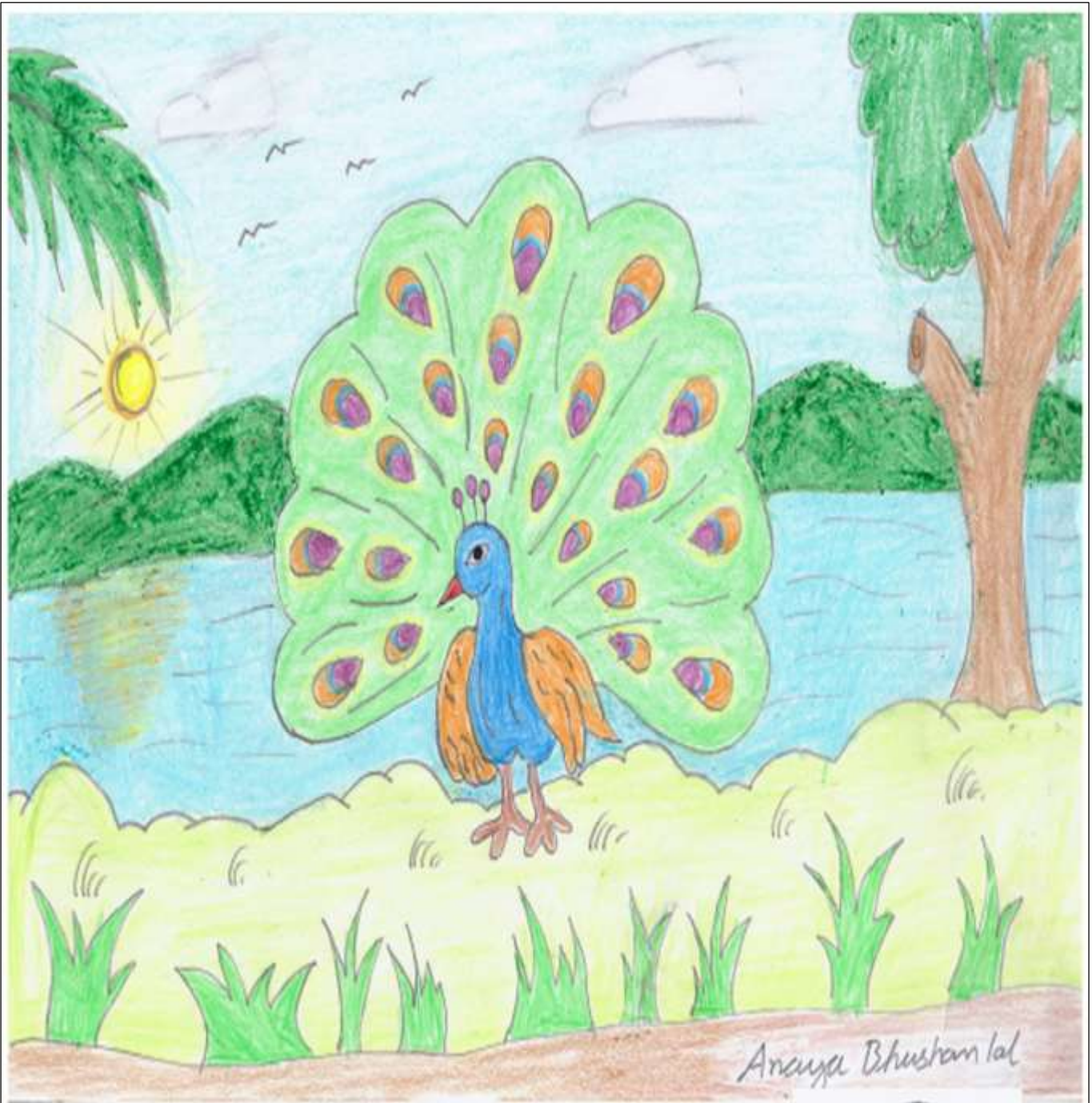
Grade 2, Ambadi