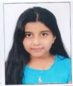
DEVI 4 th GRADE OUR OWN ENGLISH HIGH SCHOOL PRAHLADA (BALABHARMI).